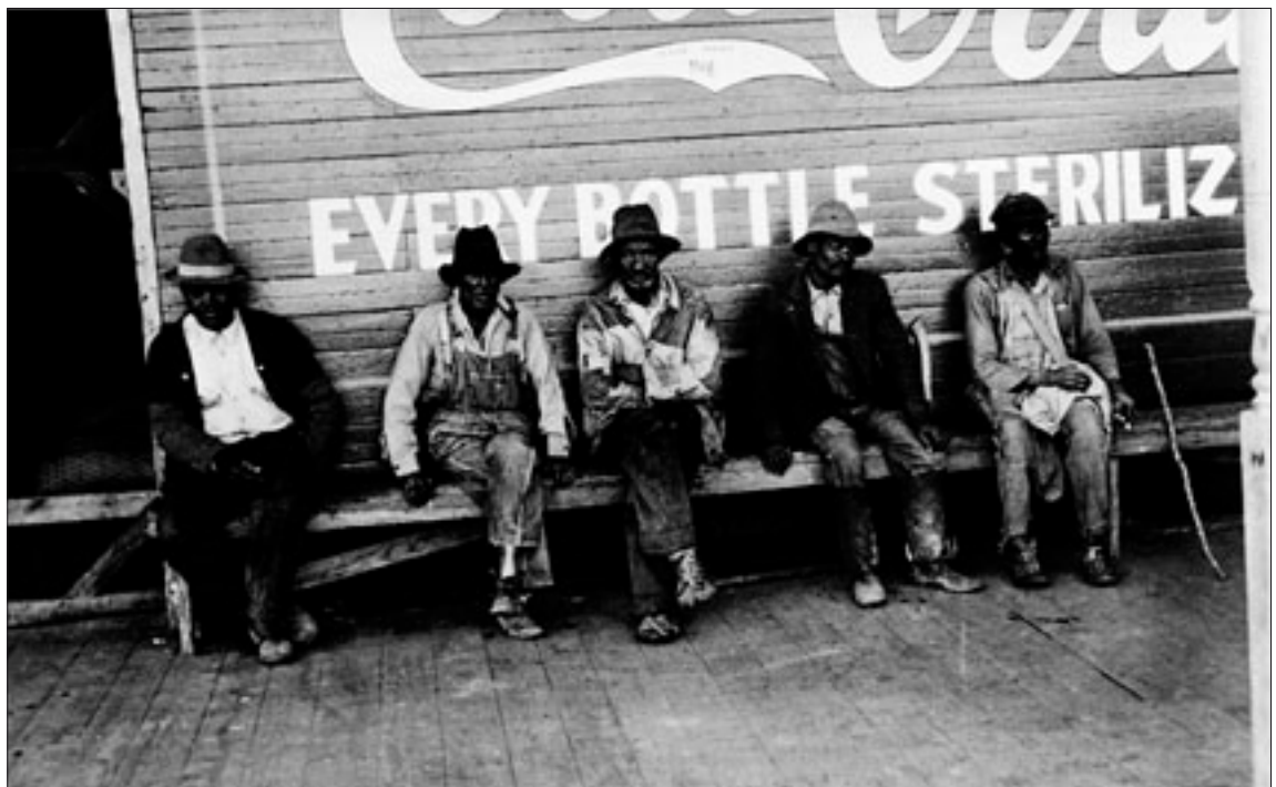
«Hombres y anuncio de Coca-Cola, cerca de Nueva Orleans» (1935), fotografía de Walker Evans

nales del sector artístico: «La comunidad artística, tanto la castellano leonesa como la nacional, pide que la gestión de la cultura sea transparente, democrática y participativa, y que los directores de museos y centros sean elegidos mediante concurso, de convocatoria abierta, en el que un jurado de expertos independiente elija el mejor proyecto», apunta el comunicado.